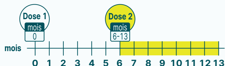
Schéma en 2 doses

La 2 ème dose doit être administrée dans un intervalle entre 6 et 13 mois après la 1 ère